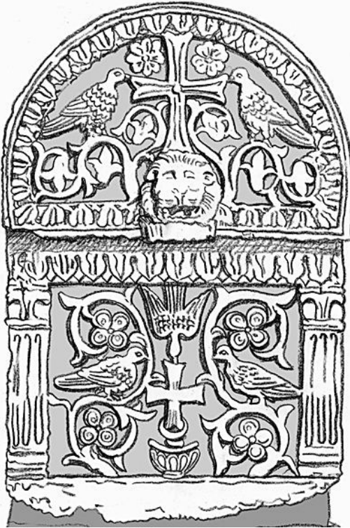
【図2 ラヴェンナの石棺】

ラゴンのような爬虫類、時に獅子のような獣を彷彿とさせる(図1)。聖書や教父たちの著作は、獅子やドラゴンなどの顎に呑み込まれるという隠喩で危機にさらされる魂を頻繁に表現している。