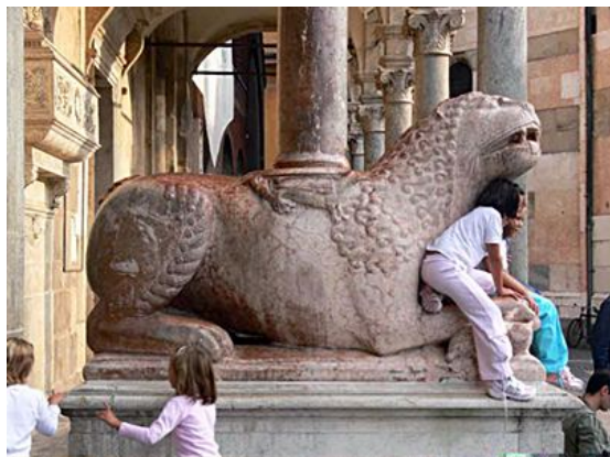
【図3 クレモナ大聖堂、ファサードの獅子】

為そのものに、現代の私たちより厳粛な畏れを抱いていたと考えられる。そしてその恐怖心は聖所の入り口という場所であれば、なおさら高まったに違いない。