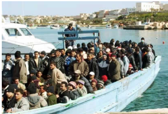
【湾岸警備隊の検問を受ける難民】

からでしょうか、異文化・異人種に対しては比較的寛容な人々であると思いますが、時には人種差別のからむトラブルや事件が発生しているのも事実であり、現代イタリア社会の抱えるジレンマとして外国人居住者のイタリア社会への溶け込みや融合を促進する制度・仕組み作りが欠くことのできない課題となっています。