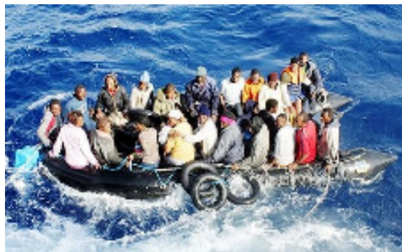
【ゴムボートで漂流するアフリカからの難民たち】