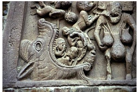
【図1 サンタ・マリア・アッスンタ教会堂、フォルノーヴォ】

3)獅子の子は死んで生まれるが、雌獅子は三日間死んだ子獅子を見守る。三日目に父がやってきて子の顔に息をふきかけると子は目をさます。父なる神が三日目にキリストを甦らせ死から目覚めさせたように、獅子は「復活・再生」の象徴である。