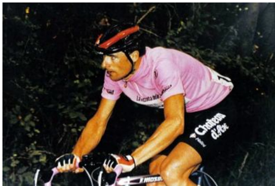
【Maglia Rosa を身にまとったジャンニ・ブーニョ】