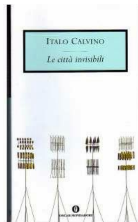
【『見えない都市』( Le città invisibili )】

カルヴィーノが1972年に発表した『見えない都市』( Le città invisibili 、米川良夫訳、河出文庫)は、ヴェネツィアの商人マルコ・ポーロがフビライ汗に語る55の幻想都市の報告と、その報告をめぐるふたりの会話から成っている。いずれの都市にも、女性の名前がつけられている。