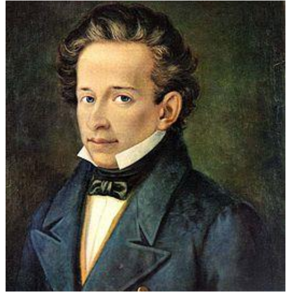
【ジャコモ・レオパルディの肖像】

ーニの文学やジュゼッペ・ヴェルディの音楽が重要な役割を担ったと考えられる。リソルジメント(Risorgimento=[イタリアの]再生)という表現が指し示すのは、こうした多面的な性質を内包するイタリア誕生の物語である。